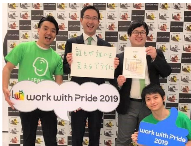
10月11日に開催されたwwPセミナー（代表取締役社長 森、ダイバーシティチームメンバー）

当社は194企業・団体の応募がある中で、5点満点の最高評価である「ゴールド」の評価を4年連続で獲得しました。